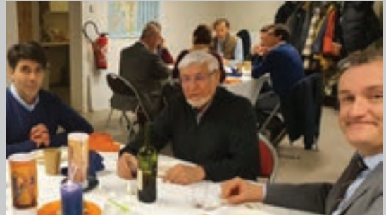
Une rencontre EDC

Mardi 20 septembre de 19h30 à 22h, salle Saint Furcy, au 35 Rue du 27 Août 1944 à Lagny