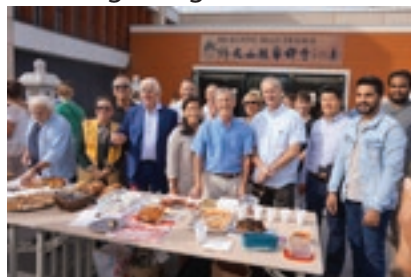
Journée européenne du patrimoine 2018 - Goûter à la Pagode

Comme tous les ans, les journées européennes du patrimoine reviennent le 19 et 20 septembre 2020. C'est le moment de profiter gratuitement de la richesse culturelle et patrimoniale dans le but « d'apprendre pour la vie » qui est le slogan de cette année. Nous participons à cet événement en proposant la visite de Notre Dame du Val (samedi 19 de 10h à 18h et dimanche 20 de 13h à 18h), mais aussi des églises de notre secteur dans la mesure des disponibilités locales. Par ailleurs, l'association de l'Esplanade des Religions et des Cultures dont la charte stipule le désir de connaître les religions et les cultures ainsi que celui de faire vivre les relations de fraternité a élaboré un programme très riche de rencontres