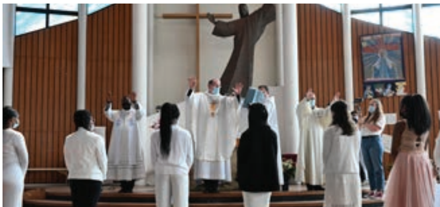
Confirmation NDV 30 mai 2021