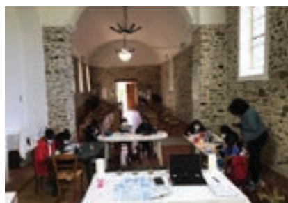
Module Marie équipe KT Collégien

Ce mois de mai est aussi marqué par des temps forts : préparation au baptême et à l'Eucharistie.