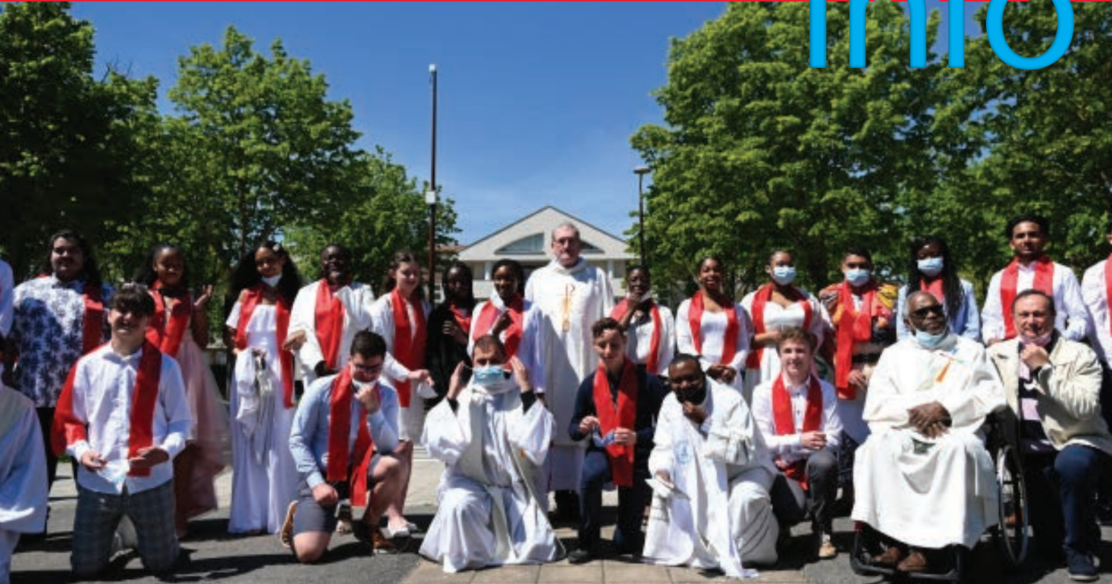
Confirmation NDV 30 mai 2021