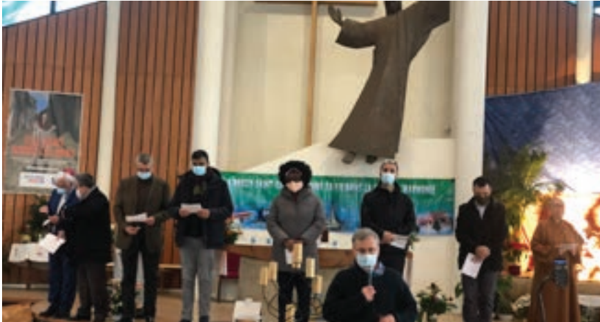
Voeux 1er janvier 2021

En mai, un violent conflit a eu lieu en Israël et Palestine. Les responsables de l'Esplanade des Religions et des Cultures n'ont pas voulu rester silencieux. Ils ont élaboré ce message qui a été diffusé dans toutes les communautés. Des démarches vont être faites ce mois-ci auprès de l'UNESCO pour relayer ce message.