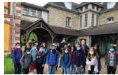
Retraite La Houssaye