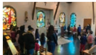
Retraite la Houssaye

« C'était vraiment sympa de se retrouver avec les parents et enfants que l'on connaît finalement peu, dans un cadre magnifique. En rentrant j'étais un peu fatigué, toutefois avec la dimension spirituelle de cette journée, j'étais serein et tout simplement bien. » Didier (papa de Baptiste)