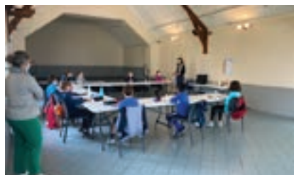
Module Marie équipe KT Bussy St Martin

Les rencontres caté se déroulent en distanciel ou en présentiel dans le respect des règles sanitaires.