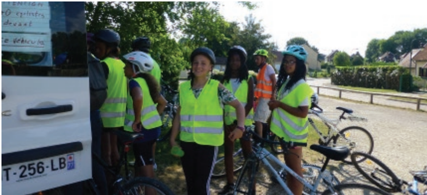
Camp vélo 2018

Cette année le camp missionnaire vélo aura lieu en baie de Somme, dans la ville du Crotoy. Située à 3 heures de Bussy, le trajet se fera en car de Notre-Dame du Val à 8h30. Rendez-vous dès 8h pour le chargement des vélos dans la camionnette qui suit le car et transporte les vélos. Retour le jeudi 4 juillet vers 20h à Notre-Dame Du Val. Installation au Camping Le Ridin : montage des tentes et des installations, puis messe à Rue célébrée par un prêtre venu du Congo. Voici succinctement le programme du Camp Missionnaire en Baie de Somme. Nous utilisons toujours nos vélos en pistes cyclables sécurisées pour le tour de la Baie de Somme (Saint Valéry, phare), messe à Saint Valéry sur Somme, balade dans la baie pieds nus, observations des phoques de loin et des oiseaux, promenade jusqu'à Abbeville par le canal