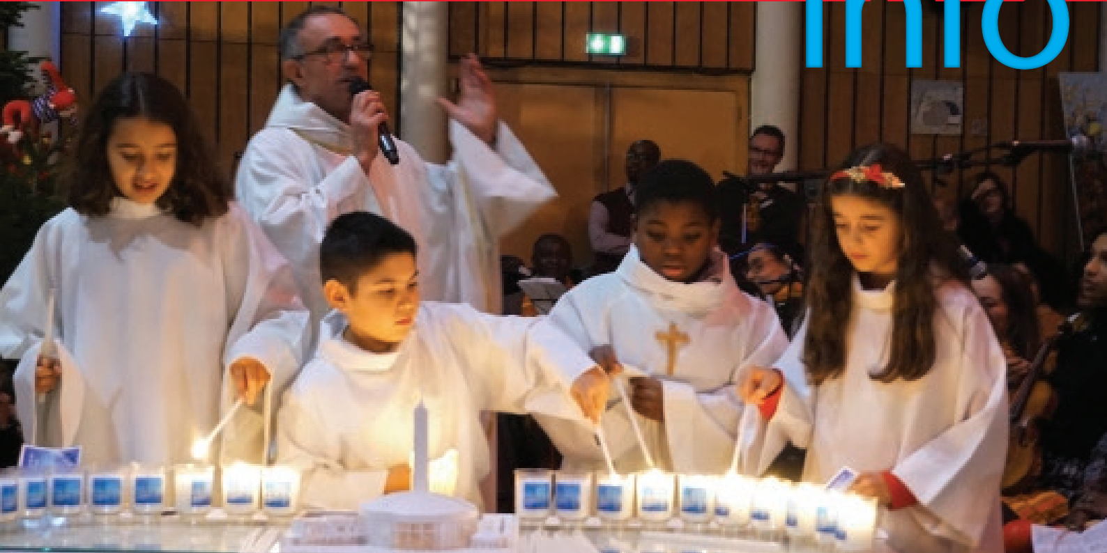
20 ans de Notre-Dame du Val