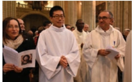
La joie d'accueillir un nouveau diacre