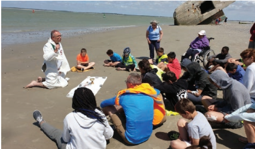
Messe sur la plage au camp vélo 2019 au Cretoy