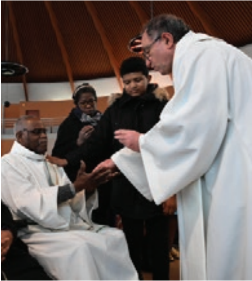
Redonner de la force ....