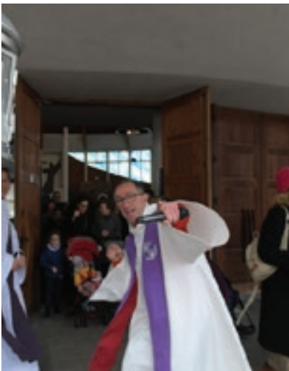
Liturgie ou rap ?