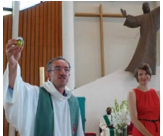
Deviens prêtre, prophète et reine !