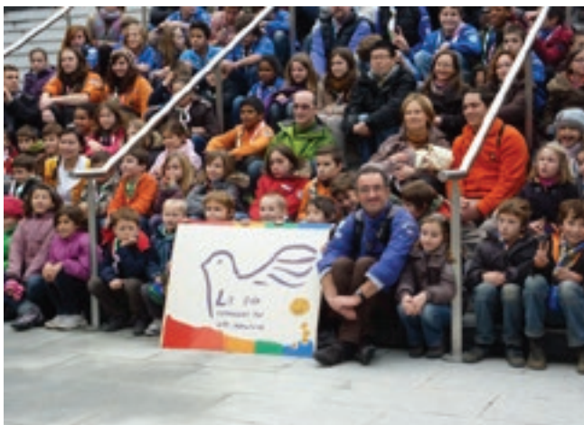
Apporter la lumière de Bethléem avec les scouts à la Pagode .... Quelle joie !