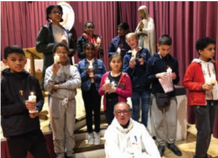
Un pèlerinage à Lourdes ! Quel meilleur moment pour faire sa profession de foi ?