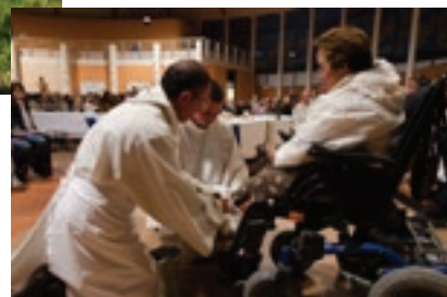
Savoir revêtir le tablier du serveur