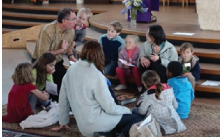
Que de regards attentifs pour écouter la Bonne Nouvelle !