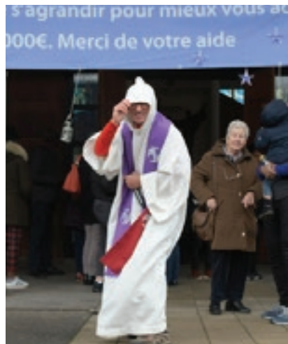
Sous la pluie ou le soleil, à cœur vaillant, rien d'impossible