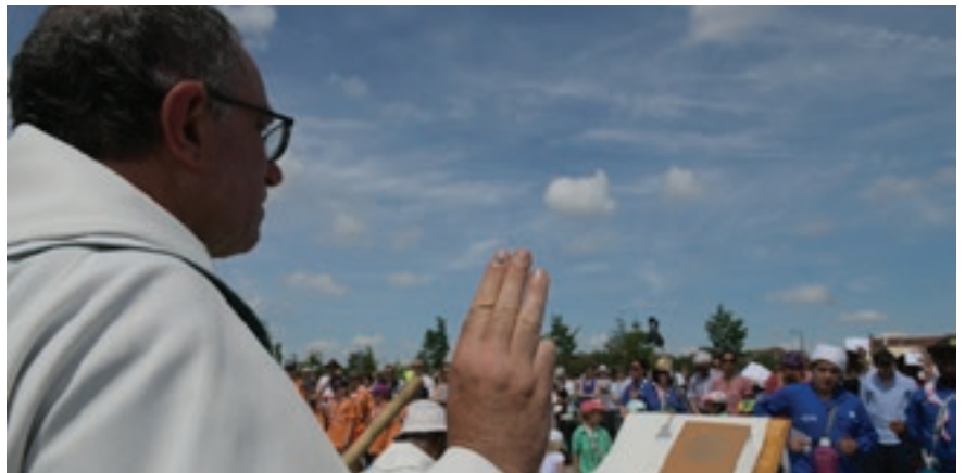
Scout toujours .... prêt !