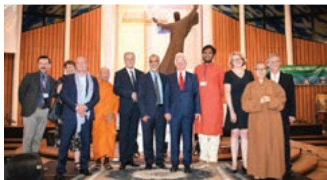
Gala de la Paix 2018

Une grande soirée d'hommage aura lieu le samedi 28 janvier à Notre Dame du Val à 20h. Elle commencera par le spectacle des enfants sur l'aventure de l'Esplanade, il y aura des témoignages, des chants et de la musique, des vidéos et beaucoup d'amitié partagée. ●