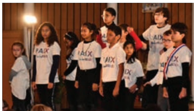
Gala de la Paix 2021