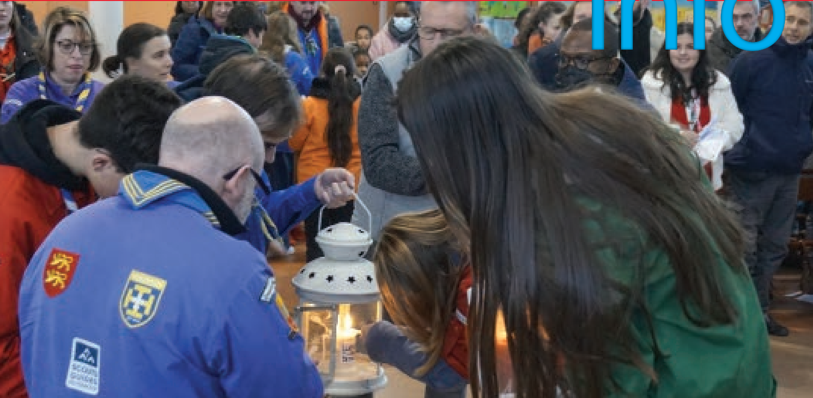
Arrivée et transmission de la lumière de la paix à Notre-Dame du Val