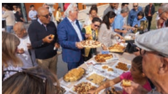
Goûter des cultures - septembre.2018