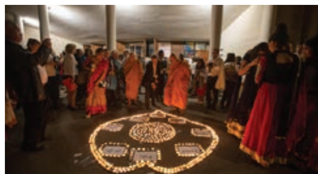
Gala de la Paix 2018