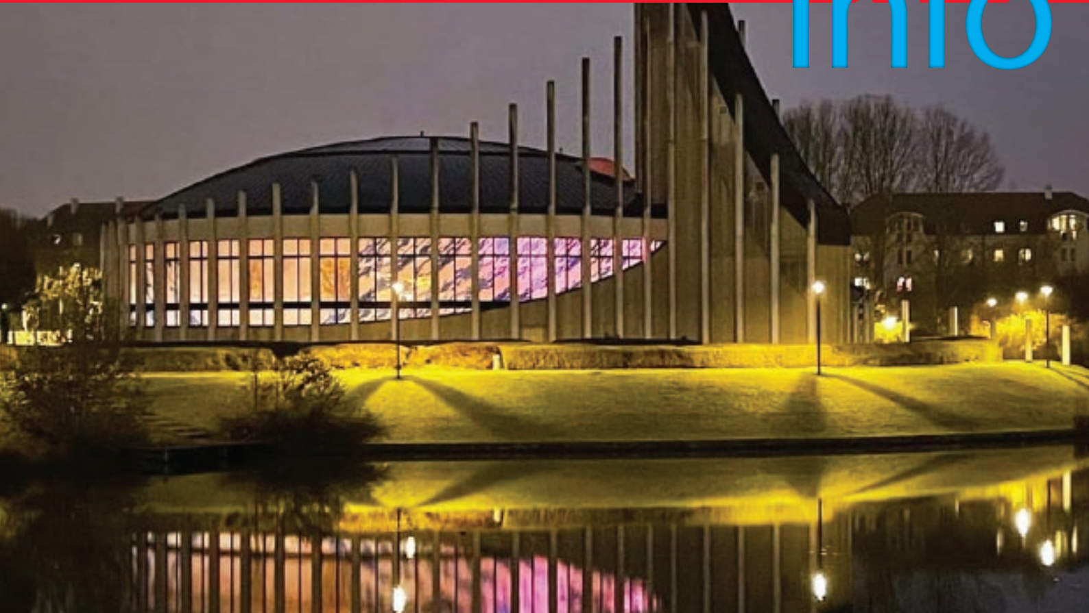
L'église Notre-Dame du Val vibrait de toutes ses lumières durant le gala pour la paix 2021