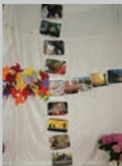
Croix réalisée par les enfants à l'issue des activités

Marie : "une bonne idée cette messe célébrée pour le caté, les enfants sont contents, ils ont bien participé et ont bien chanté".