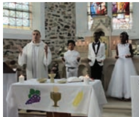
Collégien : messe du 18 juin