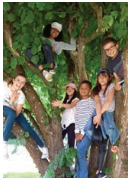
25 mai à la Houssaye en Brie