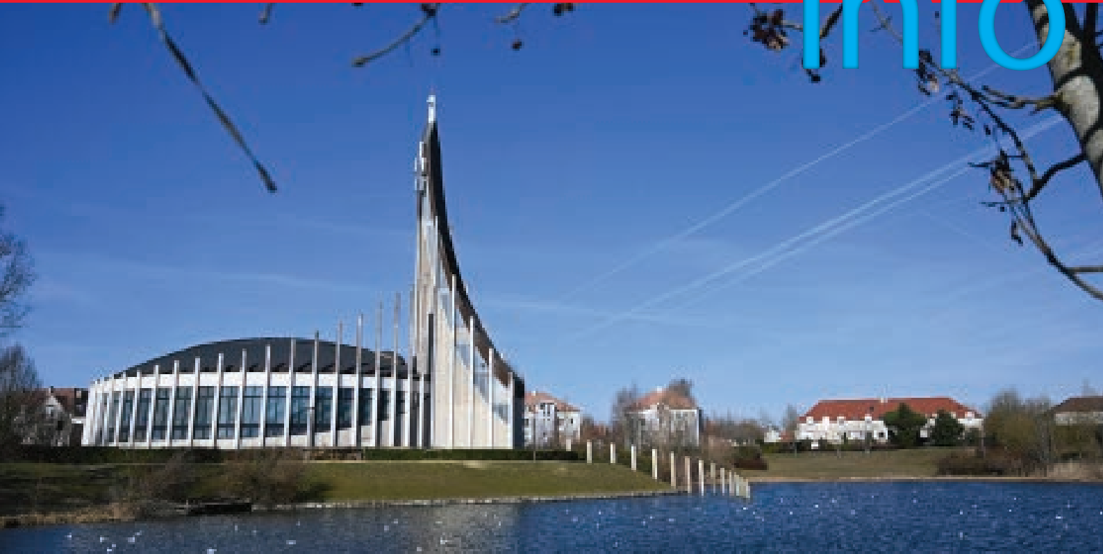
Eglise Notre-Dame du Val