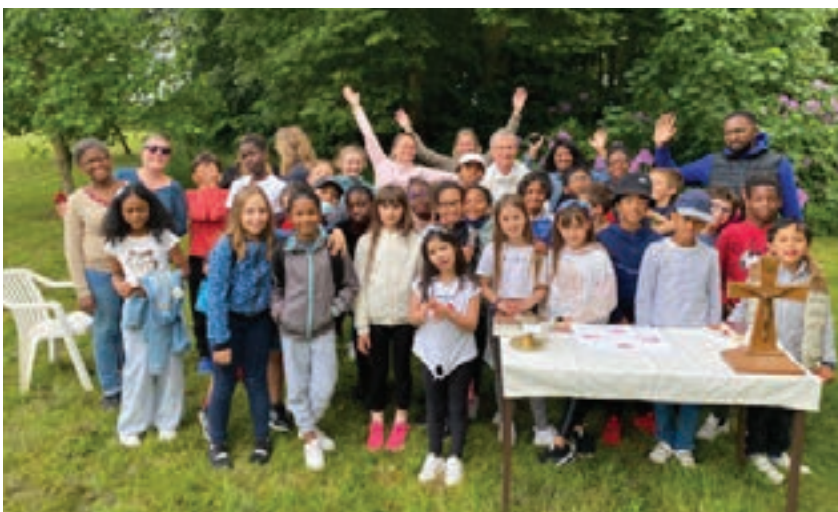
Retraite de préparation à la 1ère communion, 25 mai à la Houssaye en Brie