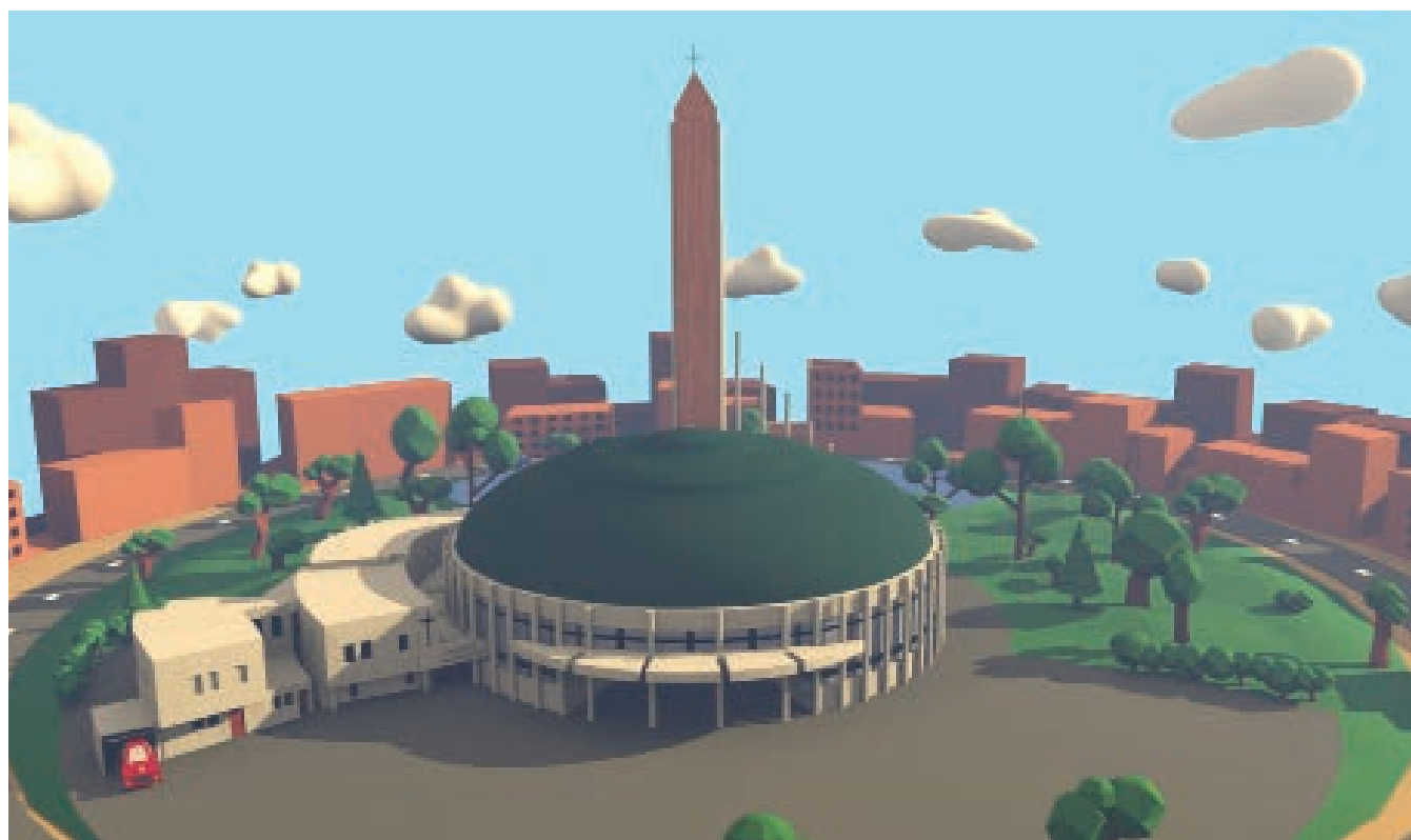
Simulation de la future maison paroissiale de Notre Dame du Val réalisée par Raoul Fernandez

Nous allons vivre une année particulière, mais une aventure enthousiasmante : Construire ensemble une maison paroissiale pour les jeunes générations, comme l'ont vécu la génération des bâtisseurs de Notre Dame du Val avant l'an 2000. C'est une chance que n'ont pas beaucoup de paroisses. ●