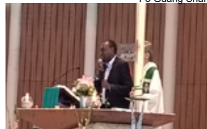
Un représentant de la communauté évangélique