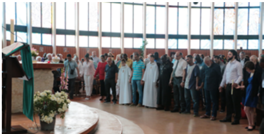
Temps de recueillement interreligieux à NDV le 31 juillet