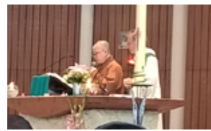
Miao Da Sik pour la communauté bouddhiste Fo Guang Shan