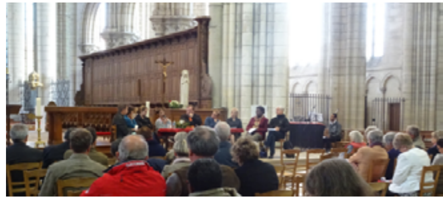
Cathédrale de Meaux - démarche synodale diocésaine de Mission en Actes