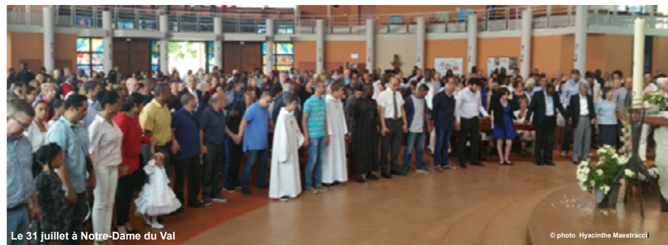
Le 31 juillet à Notre-Dame du Val

A 16h au théâtre de verdure juste en face de la pagode Fo Guang Shan: messages de fraternité des différentes religions, poèmes pour la paix lus par des enfants, hymne européen chanté par tous et collation finale.