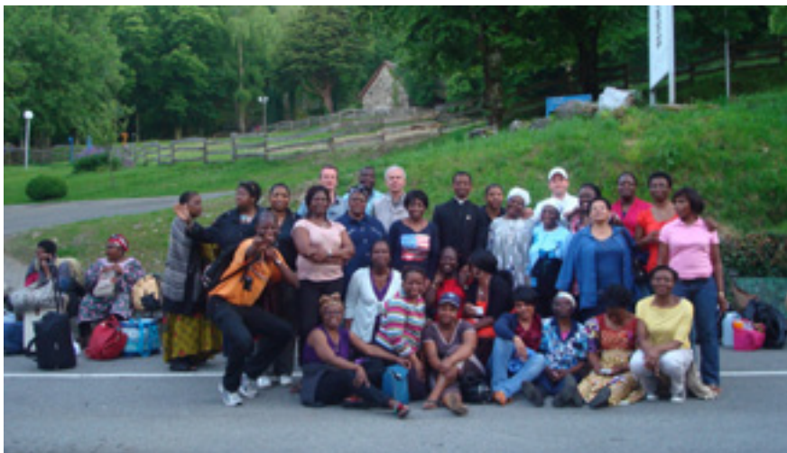
Pèlerinage de Lourdes 2014