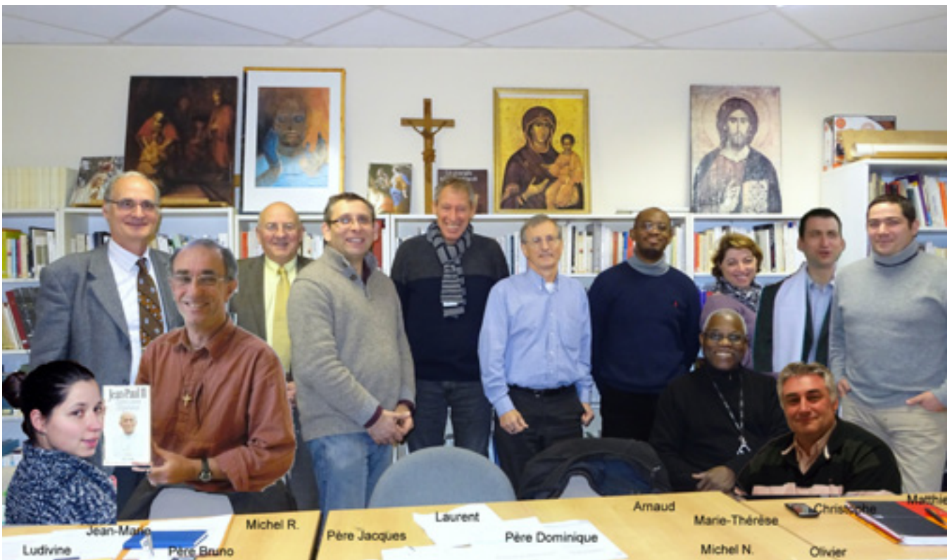
Equipe d'Animation Pastorale du secteur