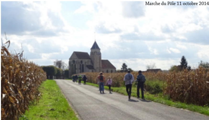
Marche du Pôle 11 octobre 2014