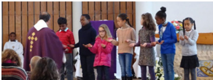
3ème étape de baptême des enfants