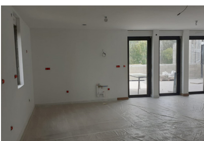
15 septembre - Le salon des prêtres est presque terminé