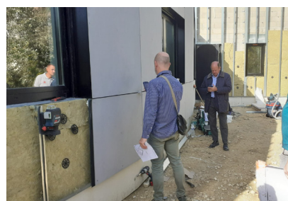
5 septembre - L'isolation extérieure de la grande salle commence