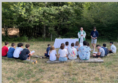
Les scouts et guides