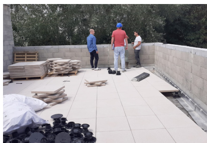
4 juillet - Finition de la terrasse du premier étage