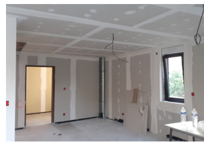
8 juillet - les cloisons des appartements des prêtres sont installées