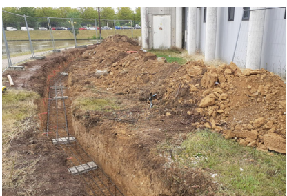
25 juillet - Les fondations pour le mur de clôture du terrain