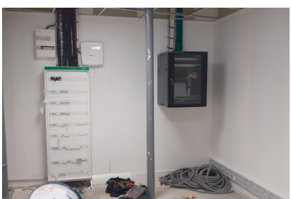
14 septembre - Le tableau électrique et celui de la fibre sont installés