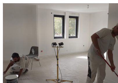
20 septembre - Les peintres terminent les appartements de l'étage