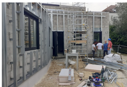
25 juin - Préparation de l'isolation extérieure du bâtiment

terminés fin novembre. Si tout se passe bien, nous pourrions inaugurer la nouvelle maison paroissiale à Noël, au moment où notre évêque viendra célébrer les 25 ans de l'église, puisque la première messe a eu lieu à Noël 1998.