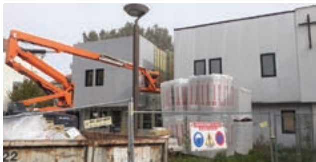
3 octobre 2023 - L'isolation et le parement extérieurs commencent.

ou début décembre, pour faire venir la commission de sécurité dans la foulée.