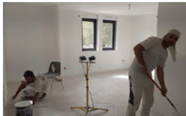
15 octobre 2023 - Les peintures de l'étage sont en cours.