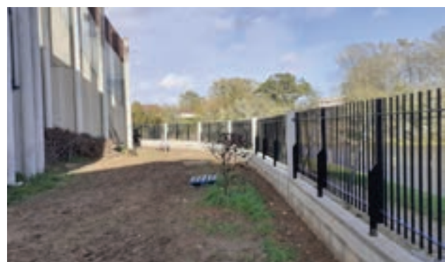
3 novembre 2023 - Installation de la clôture extérieure.