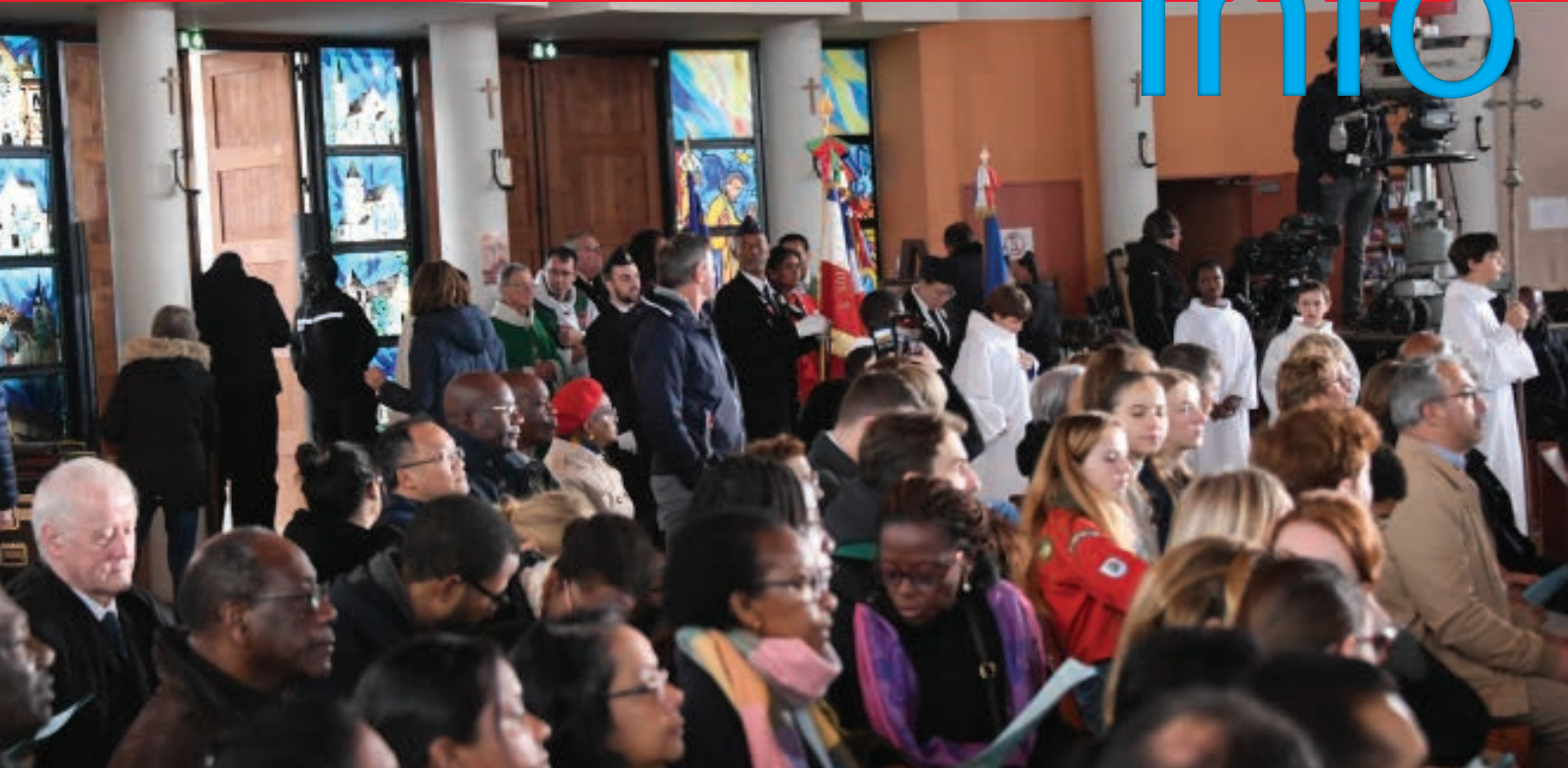
Début de la messe télévisée