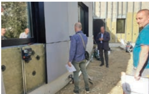
20 octobre 2023 - L'isolation et le parement extérieur sont en voie de finalisation.