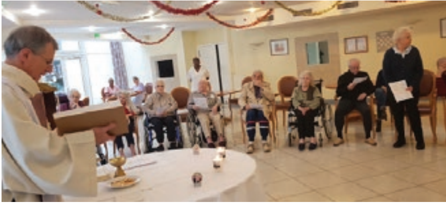
Maison de retraite les Jardins de Bussy