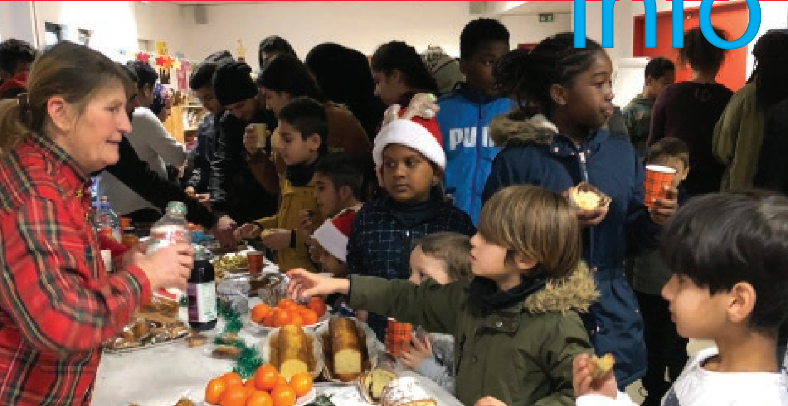
Noël 2018 du Secours Catholique