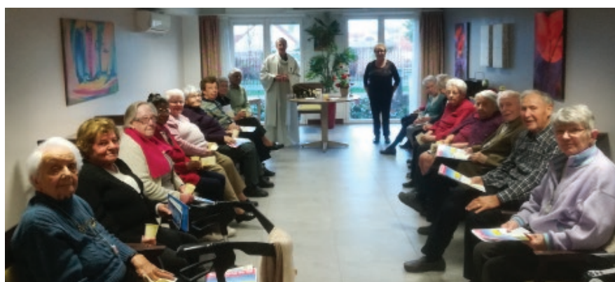
Résidence la Girandière

Quand je les visite, je dis une prière de bénédiction et on dit le Je vous salue Marie. Souvent ils réclament la communion. Il ne faut pas les en priver ●