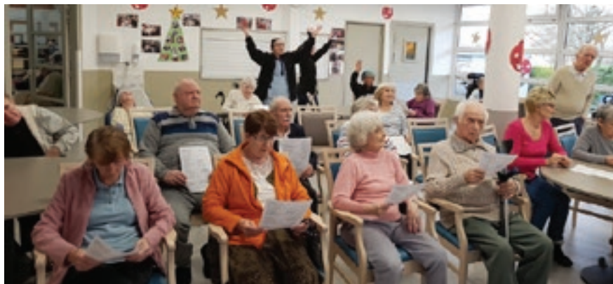
Maison de retraite Eleusis

Le dimanche 10 février est la Journée mondiale des malades. Il y aura le sacrement des malades à la messe de Notre Dame du Val. On y parlera aussi de l'Hospitalité de Lourdes. Avec le Service évangélique des malades, des messes sont célébrées plusieurs fois par an dans nos maisons de retraite. Voici des échos des cinq messes qui ont eu lieu à l'occasion de Noël 2018.