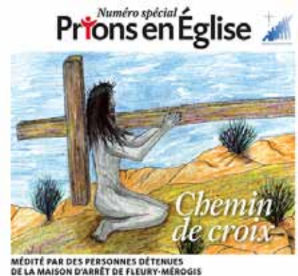
MÉDITÉ PAR DES PERSONNES DÉTENUES DE LA MAISON D'ARRÊT DE FLEURY-MÉROGIS

Jeudi Saint : la commémoration de la Cène bouscule nos habitudes : les fidèles entourent la table en forme de croix. A la fin de la célébration, un reposoir est installé près du baptistère pour l'adoration du Saint Sacrement.