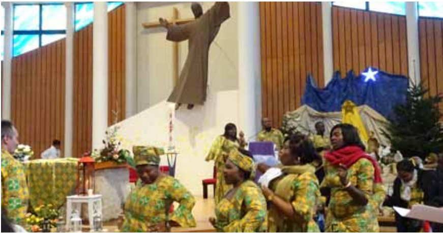
Chrétiens du Monde lors d'une célébration