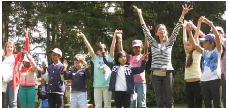
La joie lors du pèlerinage des jeunes à l'abbaye de Jouarre

« Cela m'a permis de découvrir beaucoup de choses, notamment de nouvelles prières comme l'Abba Père que je pratique tous les soirs. Ce pèlerinage m'a rapproché de Jésus et de sa famille. » Juste avant de déjeuner, les