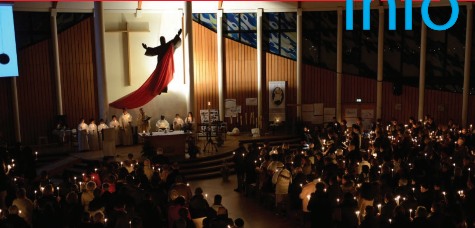
Vigile pascale à Notre-Dame du Val 2016