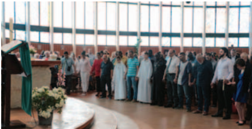
Temps de recueillement interreligieux à NDV le 31 juillet