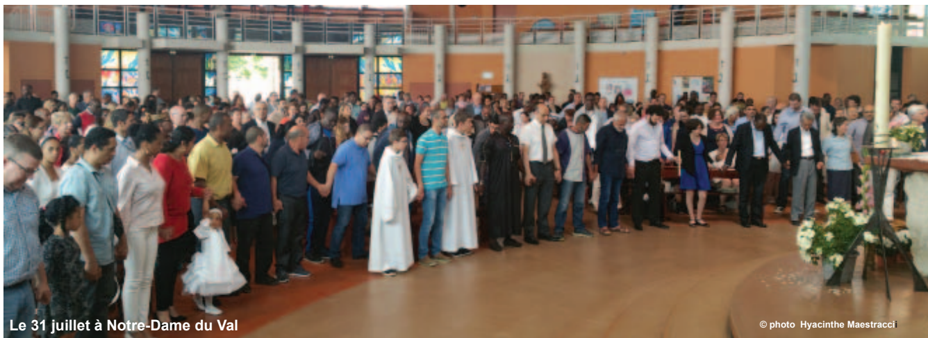
Le 31 juillet à Notre-Dame du Val

A 16h au théâtre de verdure juste en face de la pagode Fo Guang Shan: messages de fraternité des différentes religions, poèmes pour la paix lus par des enfants, hymne européen chanté par tous et collation finale.