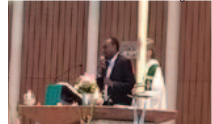
Un représentant de la communauté évangélique